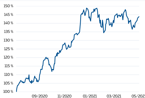
Wertentwicklung (inkl. Ausschüttung) zwischen 03.08.2020 und 31.05.2021