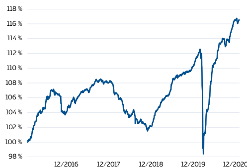
Wertentwicklung (inkl. Ausschüttung) zwischen 29.01.2016 und 29.01.2021